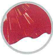
ลอนใหญ่ (แดง) Large round wave (Red)