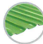
ลอนเหลี่ยม (เขียว) Square wave (Green)