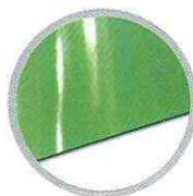
แผ่นเรียบ (เขียว) Flat sheet (Green)