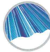
ลอนใหญ่ (น้ำเงิน ปรายมุก) Large round wave (Blue Metallic)