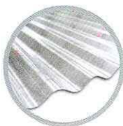
ลอนใหญ่ Large round wave