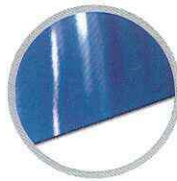
แผ่นเรียบ (น้ำเงิน) Flat sheet (Blue)