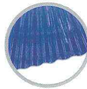
ลอนเล็ก (น้ำเงิน) Small round wave (Blue)