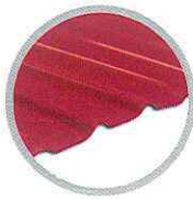
ลอนเหลี่ยม (แดง) Square wave (Red)