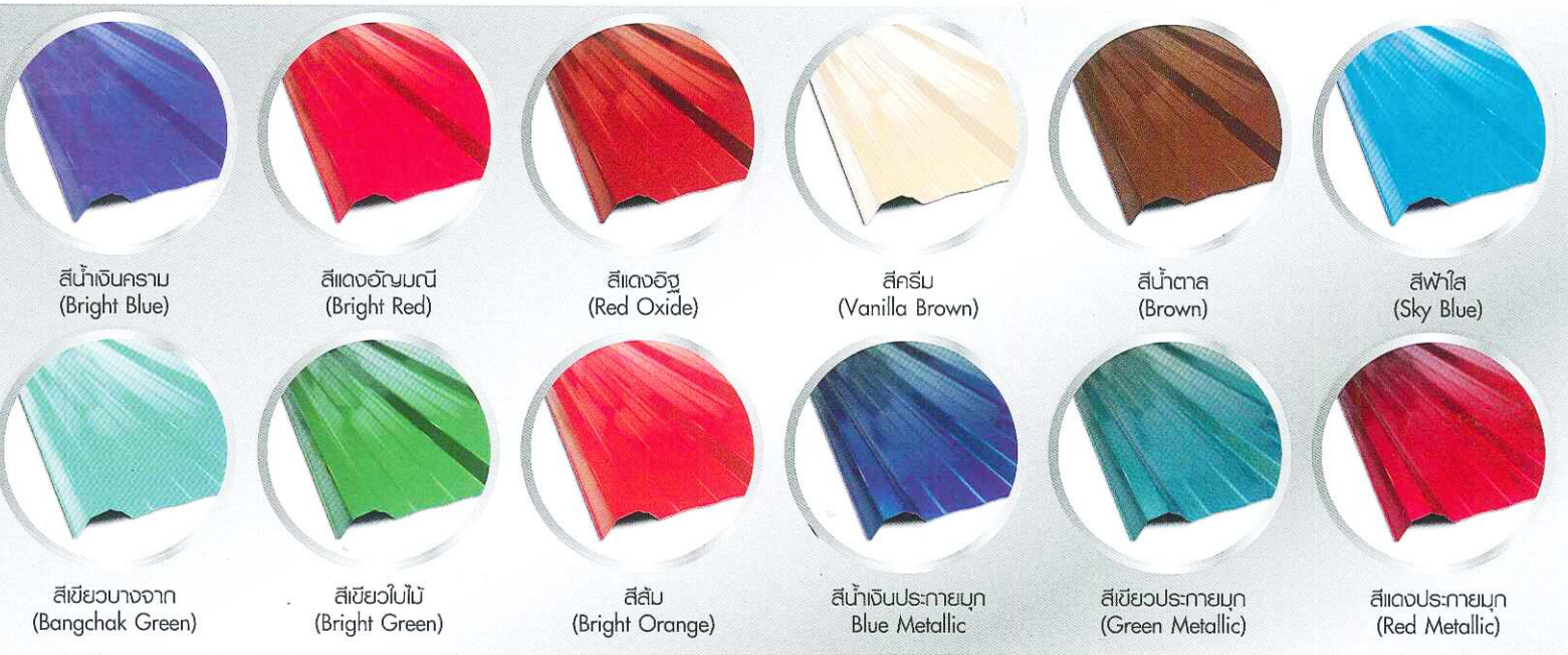
สีน้ำเงินคราม (Bright Blue)

แผ่นเหล็กกล้าแข็งแรงสูง ( Hi - Tensile Steel ) เคลือบสี ที่มี Yield Strength G800 Mpa. มีคุณสมบัติเด่น น้ำหนักเบา มีความยืดหยุ่นสูงทนทานยาวนานกว่า และเคลือบด้วยสีสะท้อนความร้อน ทำให้บ้านเย็นสบายน่าอยู่ตลอดทั้งวันทั้งคืน