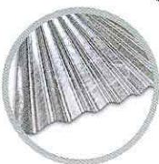
ลอนเล็ก Small round wave