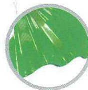
ลอนใหญ่ (เขียว) Large round wave (Green)