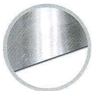
แผ่นเรียบ Flat sheet