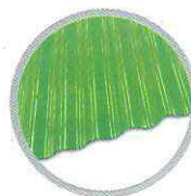
ลอนเล็ก (เขียว) Small round wave (Green)