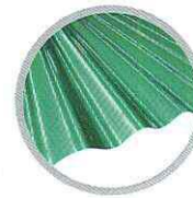
ลอนใหญ่ (เขียว ปรายมุก) Large round wave (Green Metallic)