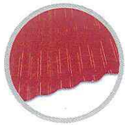
ลอนเล็ก (แดง) Small round wave (Red)